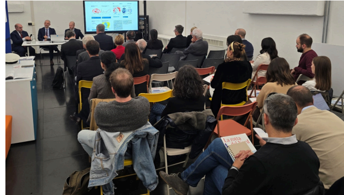
Schiano di Pepe, Pellerano, Parigi

Il lavoro dei ricercatori genovesi vuole essere uno strumento di riflessione per il settore portuale e logistico italiano, che guarda con scetticismo ma anche con (fondata o meno?) preoccupazione alla creazione di una